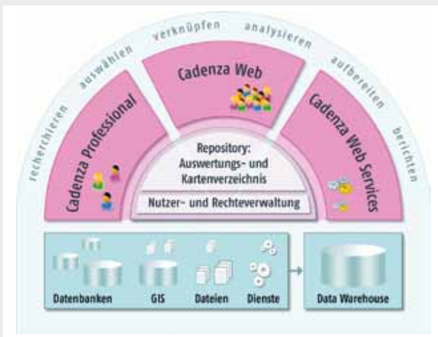
Abbildung 1: Die Cadenza Plattform.

Gerade die Europäische Union prescht in Sachen Umwelt vor. Das Ziel: mehr Informationen zum Stand der Umwelt und für die Maßnahmenplanung zur Reduktion von Umweltbelastungen. Dafür müssen unterschiedlichste Sach- und Geodaten unter einen Hut gebracht werden. Die Software Disy Cadenza 2010 kommt im Umweltbereich, aber auch im E-Government, in der Land- und Forstwirtschaft und der Räumlichen Planung oft zum Einsatz und hat sich als Auswertungs- und Berichtssystem mit GIS-Funktionalität etabliert.