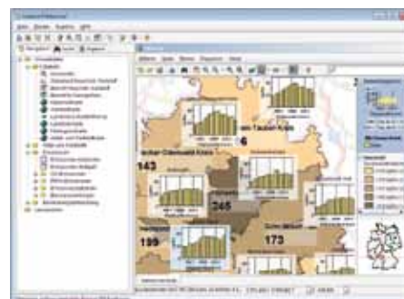
Abbildung 4: Erstellung thematischer Karten mit GISern am Beispiel des Altglasaufkommens im Alb-Donau-Kreis.

Das gleiche Prinzip greift bei Tabellenauswertungen. Regelmäßig wiederkehrende Analysen werden in Disy Cadenza anhand ihrer Auswertungsparameter gespeichert und können jederzeit und mit aktuellen Daten wieder gestartet werden.