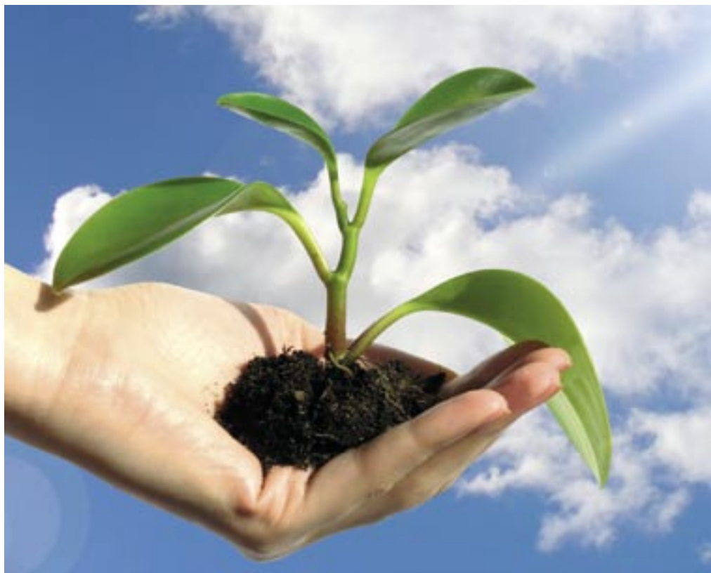
Die Umstellung auf Oracle Spatial bereitet in der LUBW den Boden für neue Webservices, für die Standardbrowser ausreichen.

Eine zweite Herausforderung war die Einbindung zahlreicher vorhandener Fachanwendungen, die auf der Basis von ArcView oder ArcGIS arbeiten. Der direkte Zugriff mit dieser Software auf Oracle Spatial wird vom Hersteller nicht unterstützt. Eigens dafür gibt es ArcSDE als sogenannte Middleware. „Die dafür notwendigen Lizenzkosten lagen jedoch außerhalb der Möglichkeiten“, erläutert Müller. LUBW und Disy entwickelten deshalb gemeinsam eigens eine Schnittstelle, die Oracle-Daten für ArcView ausliest und dabei einen so geringen Performance-Verlust erzeugt, dass man aus Anwendersicht quasi einen direkten Datenbankzugriff erlebt. Bis Ende des Jahres soll auch der umgekehrte Weg funktionieren, die Rückgabe der in ArcView geänderten Daten an Oracle Spatial.