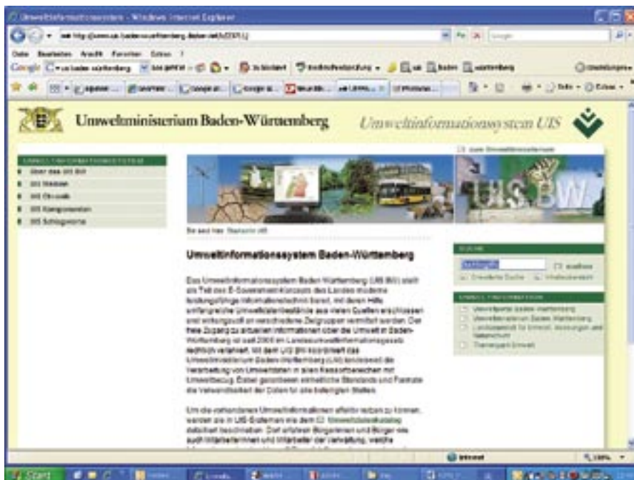
Mit bis zu 10.000 Nutzern rechnet die Landesanstalt für Umwelt, Messungen und Naturschutz Baden-Württemberg für das Umweltinformationssystem (UIS).

Doch zuletzt stieß das Gesamtsystem mit seiner proprietären Datenhaltung zunehmend an Grenzen. Zum einen stieg in vielen Behörden der Wunsch nach einfachen, am besten webbasierten Auskunftsarbeitsplätzen, für die ein Standardbrowser ausreicht. Zum zweiten gab es zunehmende Anforderungen, die Geodaten direkt innerhalb verschiedener Fachanwendungen zu pflegen, die entweder auf der Basis ganz unterschiedlicher GIS-Lösungen arbeiten oder als reine SQL-Berichtssysteme konzipiert sind. Gefragt war deshalb eine interoperable, offene Datenhaltung, die auch die jüngsten Entwicklungen zu landes- und bundesweit gültigen Standards einer Geodateninfrastruktur (GDI) berücksichtigt. „Wir wollten ein echtes Geodata-Warehouse bauen“, sagt Müller dazu. Mitte des Jahres 2006 fiel deshalb die Entscheidung der LUBW, gemeinsam mit Disy ein umfassendes Migrationsprojekt zu starten. Die angestrebten Ziele: ■ Sach- und Geodaten sollen durch standardisierte SQL-Abfragen auswertbar werden. ■ Webbasierte Auskunftsarbeitsplätze auf Basis von GDI-konformen Web-Mapping-Services (WMS) sollen einen schnellen Zugriff ermöglichen. ■ Die unter anderem in den Stadtkreisen vorhandenen ganz unterschiedlichen